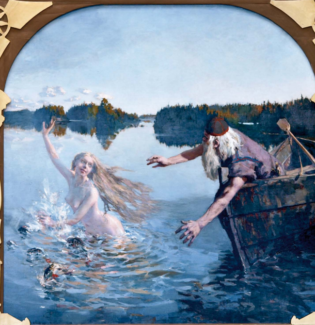
Aino pakenee Väinämöisen veneestä.