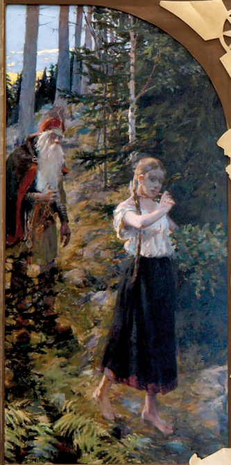
Aino ja Väinämöinen kohtaavat metsässä.