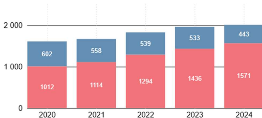
Arvo, mrd. euroa