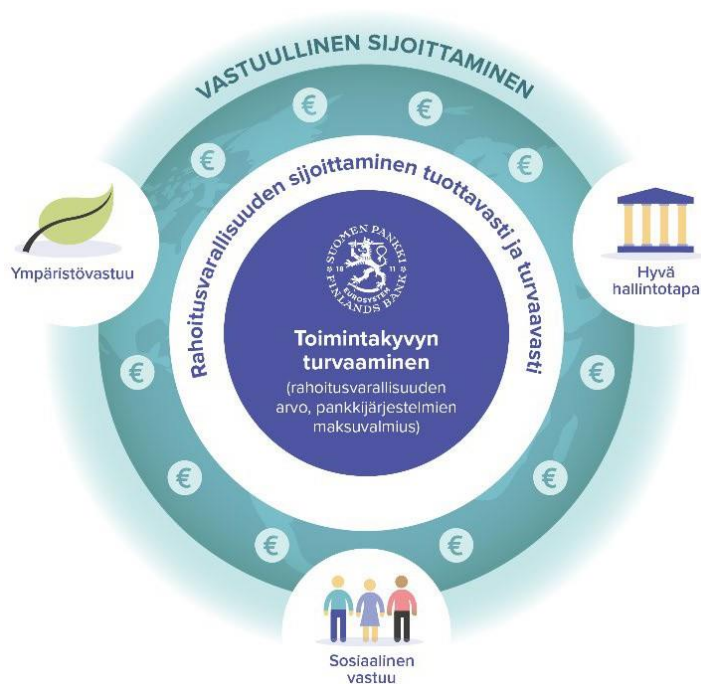
Kuva 1. Vastuullinen sijoittaminen

Keskuspankin vastuullisuus lähtee sen ydintoiminnasta. Toiminta-ajatuksemme pohjautuu taloudellisen vakauden rakentamiseen ja sitä kautta ihmisten hyvinvoinnin edistämiseen. Suomen Pankin vuonna 2019 käyttöön ottaman vastuullisuusohjelman yksi painopisteistä on ilmatoriskien hallinta. Sijoittamalla vastuullisesti Suomen Pankki antaa myös panoksensa ilmastotyöhön. Olemme julkisesti sitoutuneet liittämään ympäristöön, sosiaaliseen vastuuseen ja hyvään hallintotapaan liittyvät tekijät osaksi sijoituspäätösten tekoa ja omistajakäytäntöjä allekirjoitetuamme YK:n tukemat vastuullisen sijoittamisen periaatteet (PRI) joulukuussa 2019. Periaatteiden allekirjoittaminen tarkoittaa sitä, että rahoitusvarallisuuden hallinnassa olemme sitoutuneet vastuullisuuteen, kehitämme vastuullisen sijoitustoiminnan käytäntöjä aktiivisesti ja raportoimme edistymisestä vuosittain. Vastuullinen sijoittaminen ei heikennä pankin tekemien sijoitusten tuotto- riskisuhdetta.