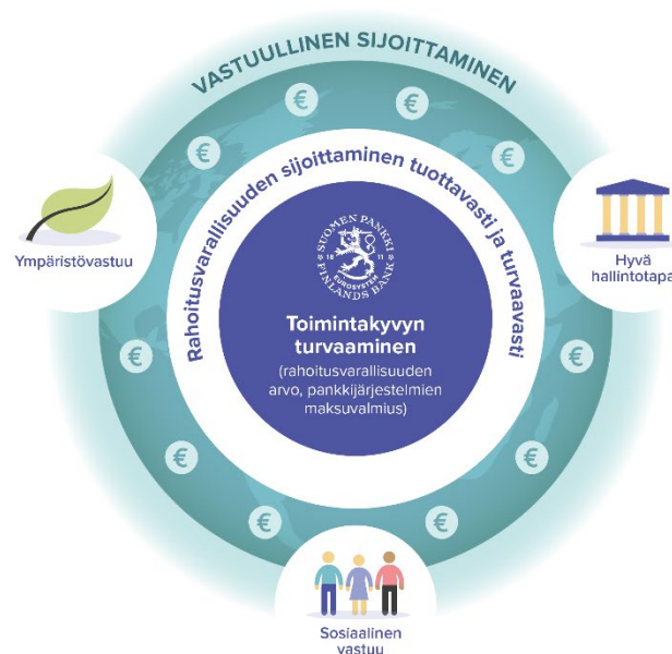
Kuva 1. Vastuullinen sijoittaminen

Keskuspankin vastuullisuus lähtee sen ydintoiminnasta. Toiminta-ajatuksemme pohjautuu taloudellisen vakauden rakentamiseen ja sitä kautta ihmisten hyvinvoinnin edistämiseen. Suomen Pankin vuonna 2019 käyttöön ottaman vastuullisuusohjelman yksi painopisteistä on ilmatoriskien hallinta. Sijoittamalla vastuullisesti Pankki antaa myös panoksensa ilmastotyöhön. Olemme julkisesti sitoutuneet liittämään ympäristöön, sosiaaliseen vastuuseen ja hyvään hallintatapaan liittyvät tekijät osaksi sijoituspäätösten tekoa ja omistajakäytäntöjä allekirjoitettuamme YK:n tukemat vastuullisen sijoittamisen periaatteet (PRI) joulukuussa 2019. Periaatteiden allekirjoittaminen tarkoittaa sitä, että rahoitusvarallisuuden hallinnassa olemme sitoutuneet vastuullisuuteen, kehitämme vastuullisen sijoitustoiminnan käytäntöjä aktiivisesti ja raportoimme edistymisestä vuosittain. Vastuullinen sijoittaminen ei heikennä pankin tekemien sijoitusten tuotto-riskisuhdetta.