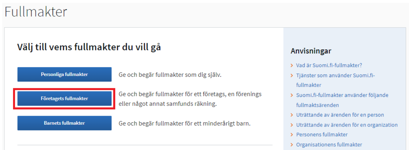
Bild 3. Efter inloggning i tjänsten Suomi.fi-fullmakter väljer du för vem du vill uträtta ärenden.

Efter inloggning väljer du för vem du vill uträtta fullmaktsärenden. En firmatecknare väljer Företagets fullmakter: