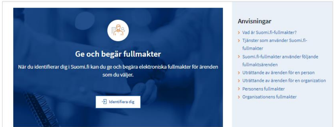
Bild 2. Suomi.fi-fullmakter.

Efter inloggning väljer du för vem du vill uträtta fullmaktsärenden. En firmatecknare väljer Företagets fullmakter: