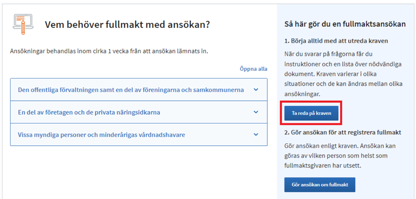
Bild 13. Länk till enkäten för noggranna instruktioner för ifyllande av ansökan om tjänstemannabefullmäktigande.

För att ansöka om tjänstemannabefullmäktigande gå till Suomi.fi fullmakt med ansökan . Innan ansökan om tjänstemannabefullmäktigande ifylls ska du fylla i en kort enkät, på basis av vilken du får noggranna instruktioner för ifyllande av ansökan. Läs även anvisningarna "Vem behöver fullmakt med ansökan?".